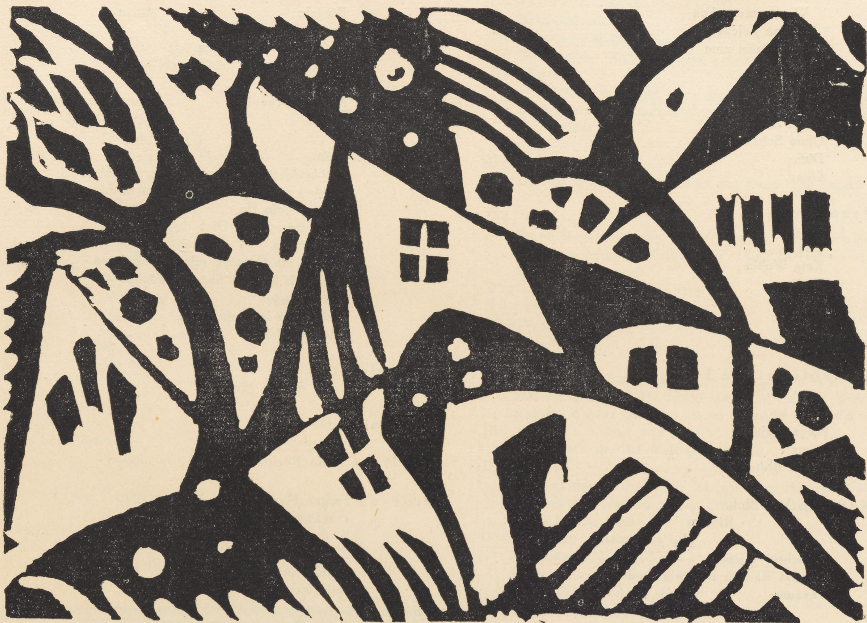
Arnold Topp: Linoleumschnitt