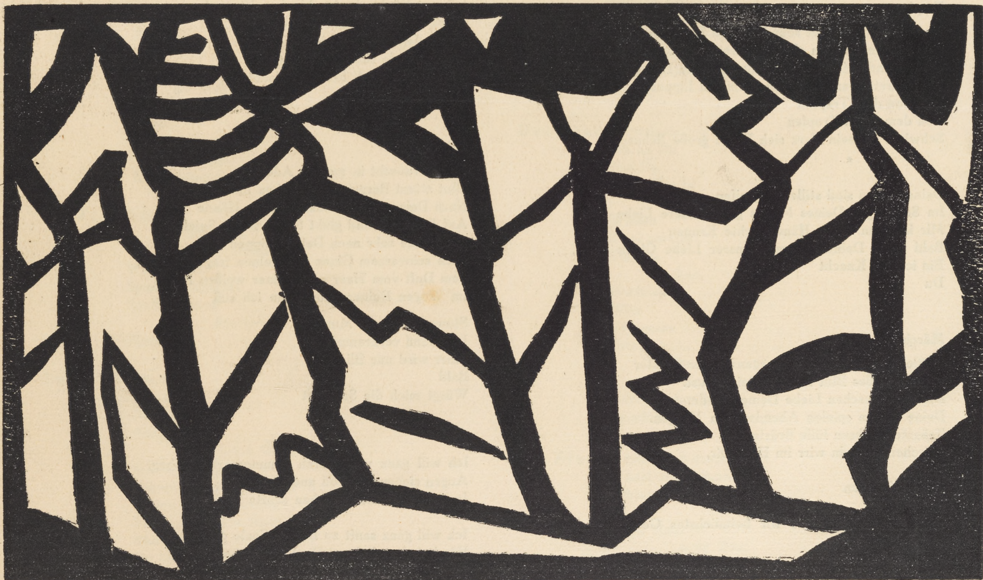
Jacob van Heemskerck: Holzschnitt / Vom Stock gedruckt